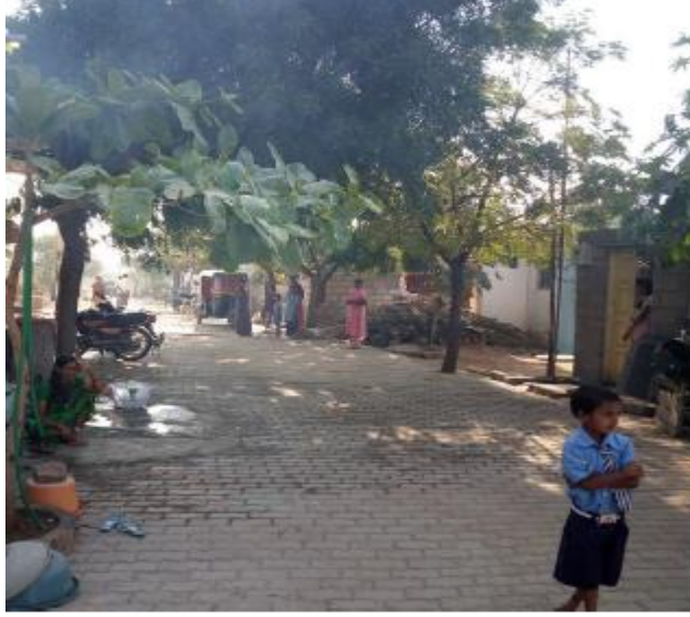
ಶೋಲಾಪುರದಲ್ಲಿರುವ ವಲಸಿಗ ಕೆಲಸಗಾರರ ವಸತಿ ಪ್ರದೇಶ

ದಶಕಗಳ ಮೊದಲು ಅತಿಯಾದ ಅಪರಾಧಗಳಿಂದಾಗಿ ಈ ನಗರವು ವ್ಯಾಪಾರಕ್ಕೆ ಸುರಕ್ಷಿತವಾಗಿರಲಿಲ್ಲ, ಆಗ ಜಿಲ್ಲೆಯ ಜನರು ಶೋಲಾಪುರಕ್ಕೆ ವಲಸೆ ಹೋಗುತ್ತಿದ್ದರೆಂದು ಬೆಳಗಾವಿಯ ಒಬ್ಬ ಪತ್ರಿಕೋದ್ಯಮಿಯು ತಿಳಿಸಿದರು. ಉತ್ತರ ಕನ್ನಡ ಜಿಲ್ಲೆಯ ಜೋಯ್ಡಾ ತಾಲೂಕಿನ ಜನರು, ಪುಣೆ, ಗೋವಾ ಅಲ್ಲದೇ ಮೈಸೂರು ಮತ್ತು ಬೆಂಗಳೂರನ್ನು ವಲಸೆ ಹೋಗಲು ಆಯ್ದುಕೊಂಡರು.