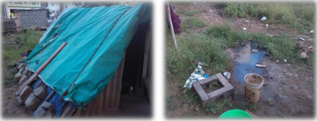
ಬೆಂಗಳೂರಿನಲ್ಲಿರುವ ವಲಸಿಗರ ಸೂರು

ಸ್ಥಿತಿಯಲ್ಲಿ ಬದುಕುತ್ತಿದ್ದರು. ಬೆಂಗಳೂರಿನ ಐಡಿಯಲ್ ಹೋಮ್ ಕ್ಲಬ್, ಕೆಂಚನಹಳ್ಳಿ, ಆದಿತ್ಯ ಲೇ ಔಟ್, ಬೇಗೂರು, ಬಂಗಾರಪ್ಪ ಗುಡ್ಡೆ, ಉತ್ತರಹಳ್ಳಿ ಮತ್ತು ರಾಜರಾಜೇಶ್ವರಿ ನಗರದಲ್ಲಿರುವ ವಲಸಿಗರ ಅಧ್ಯಯನ ನಡೆಸಲಾಯಿತು. ಇವುಗಳಲ್ಲಿ ಮೊದಲ ಮೂರು ನಿವಾಸಗಳಲ್ಲಿ ವಿದ್ಯುತ್, ನೀರು ಮತ್ತು ಶೌಚಾಲಯ ಸೌಲಭ್ಯಗಳು ಇರಲಿಲ್ಲ. ಆದಿತ್ಯ ಕಾಲೋನಿಯಲ್ಲಿರುವವರಿಗೆ ಬಯಲಿನಲ್ಲಿ ಶೌಚ ಮಾಡುವುದು ಸಾಮಾನ್ಯ ಅಭ್ಯಾಸವಾಗಿತ್ತು. ಕೆಂಚನಹಳ್ಳಿ ಮತ್ತು ರಾಜರಾಜೇಶ್ವರಿ ನಗರದಲ್ಲಿ ಕಾರ್ಮಿಕರ ವಸತಿಗಳಿಗೆ ಸಾರಿಗೆ ಸಂಪರ್ಕವಿಲ್ಲದ ತಲುಪಲು ಕಷ್ಟವಾದ ಜಾಗದಲ್ಲಿದ್ದು. ಅಧ್ಯಯನದಲ್ಲಿ ಭಾಗಿಯಾದ ಬೇರೆ ರಾಜ್ಯದವರು ಬೇಗೂರು ಪ್ರದೇಶದಲ್ಲಿ ವಾಸಿಸುತ್ತಿದ್ದರು ಮತ್ತು ಡಿಎಲ್‌ಎಫ್ ಮತ್ತು ಎಸ್‌ಆರ್‌ಎಸ್‌ನಂತಹ ದೊಡ್ಡ ಕಟ್ಟಡ ನಿರ್ಮಾಣ ಕಂಪನಿಗಳಿಗೆ ಕೆಲಸ ಮಾಡುತ್ತಿದ್ದರು. ಈ ಎಲ್ಲ ಕಾರ್ಮಿಕರ ಸೂರುಗಳಲ್ಲಿ ನೀರು, ವಿದ್ಯುತ್ ಮತ್ತು ಶೌಚಾಲಯದಂತಹ ಮೂಲಭೂತ ಸೌಲಭ್ಯಗಳಿದ್ದವು.