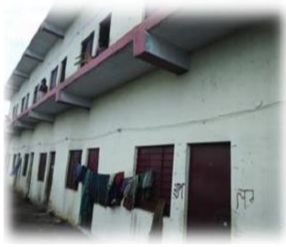
ಮೈಸೂರಿನಲ್ಲಿ ವಲಸಿಗ ಕೆಲಸಗಾರರಿಗಿರುವ ವಸತಿಗೃಹ

ಮೈಸೂರಿನಲ್ಲಿ ವಲಸೆಯು ಮುಖ್ಯವಾಗಿ ನೆಸ್ಲೆ, ಗ್ರಾನೈಟ್ ಮತ್ತು ರಬ್ಬರ್ ಕಾರ್ಖಾನೆಗಳಿರುವ ನಂಜನಗೂಡಿನಂತಹ ಹೊರವಲಯದಲ್ಲಿರುವ ಕೈಗಾರಿಕಾ ಉಪನಗರಗಳಲ್ಲಿ ಕೇಂದ್ರೀಕೃತವಾಗಿದೆ. ಕೈಗಾರಿಕಾ ವಿಭಾಗವಲ್ಲದೇ, ಮೈಸೂರಿನಲ್ಲಿರುವ ವಲಸಿಗರು ಕಟ್ಟಡ ನಿರ್ಮಾಣ, ಮನೆಗೆಲಸ, ಚಿಲ್ಲರೇ ವ್ಯಾಪಾರಗಳಲ್ಲಿ ತೊಡಗಿಸಿಕೊಂಡಿದ್ದಾರೆ. ಉತ್ತರ ಭಾರತದ ರಾಜ್ಯಗಳಿಂದ ಬಂದವರು ಹೆಚ್ಚಾಗಿ ಚಿಲ್ಲರೇ ವ್ಯಾಪಾರದಲ್ಲಿ, ಮತ್ತು ಅಕ್ಕಪಕ್ಕದ ರಾಜ್ಯಗಳಿಂದ ಬಂದ ವಲಸಿಗರು ಸಾಮಾನ್ಯವಾಗಿ ಮನೆ ಕೆಲಸದಲ್ಲಿ ತೊಡಗಿಸಿಕೊಂಡಿದ್ದಾರೆ. ಹೋಟೆಲ್‌ಗಳು ಮತ್ತು ಉಪಹಾರಗೃಹಗಳು ವಲಸಿಗರಿಗೆ ಅದರಲ್ಲೂ ಅಸ್ವಾಸ್ತಿಯ ಮತ್ತು ಇತರ ಈಶಾನ್ಯ ರಾಜ್ಯಗಳ ಅಂತರ್-ರಾಜ್ಯಗಳ ವಲಸಿಗರಿಗೆ ಜನಪ್ರಿಯ ಜೀವನ ನಿರ್ವಹಣಾ ಆಯ್ಕೆಗಳಾಗುತ್ತಿವೆ. ಅಧ್ಯಯನದ ತಂಡಕ್ಕೆ ಮೈಸೂರು ನಗರದಲ್ಲಿರುವ ನಯುರಾಬಾದ್ ಪ್ರದೇಶ ಮತ್ತು ಮೈಸೂರಿನ ಪಕ್ಕದಲ್ಲಿರುವ ಕೈಗಾರಿಕಾ ಉಪನಗರವಾದ ನಂಜನಗೂಡಿನಲ್ಲಿರುವ ವಲಸಿಗ ಕೆಲಸಗಾರರೊಡನೆ ಸಂವಹಿಸಬೇಕೆಂದು ಅಧಿಕಾರಿಗಳು ಮತ್ತು ಕಾರ್ಮಿಕ ಗುತ್ತಿಗೆದಾರರಂತಹ ಸಂಬಂಧ ಪಟ್ಟ ಅಧಿಕಾರಿಗಳು ಸಲಹೆ ನೀಡಿದರು. ಕೈಗಾರಿಕಾ ಉಪನಗರದಲ್ಲಿ, ವಲಸೆ ಬಂದ ಕೆಲಸದವರು ಉದ್ಯೋಗ ನೀಡಿದಾತ ಕಾರ್ಖಾನೆಯ ಆವರಣದಲ್ಲಿ ಒದಗಿಸಿರುವ ವಸತಿ ಸೌಕರ್ಯದಲ್ಲಿ ವಾಸಿಸುತ್ತಾರೆ. ಮೈಸೂರು ನಗರದಲ್ಲಿರುವ ನಯುರಾಬಾದ್ ಪ್ರದೇಶದ ಕಾರ್ಮಿಕರ ಕಾಲೋನಿಯಲ್ಲಿ; ಮೈಸೂರಿನ ಹೊರವಲಯದಲ್ಲಿರುವ ನಂಜನಗೂಡು ಕೈಗಾರಿಕಾ ಉಪನಗರದ ಎರಡು ಕಾರ್ಮಿಕ ಕಾಲೋನಿಗಳಲ್ಲಿ; ಮತ್ತು ನೆಸ್ಲೆ ಮತ್ತು ರೀಡ್ ಮತ್ತು ಟೀಲರ್ ಕಂಪನಿಯ ಆವರಣದಲ್ಲಿ ಅಧ್ಯಯನವನ್ನು ನಡೆಸಲಾಯಿತು. 13 ಅಂತರ್-ಜಿಲ್ಲಾ (ಯಾದಗಿರಿ ಮತ್ತು ಕೊಪ್ಪಳ) ಮತ್ತು 80 ಅಂತರ್-ರಾಜ್ಯ ವಲಸಿಗರನ್ನು ಒಳಗೊಂಡಂತೆ, ಒಟ್ಟು 93 ವಲಸಿಗ ಕೆಲಸಗಾರರನ್ನು ಮೈಸೂರಿನಲ್ಲಿ ಸಂದರ್ಶಿಸಲಾಯಿತು.