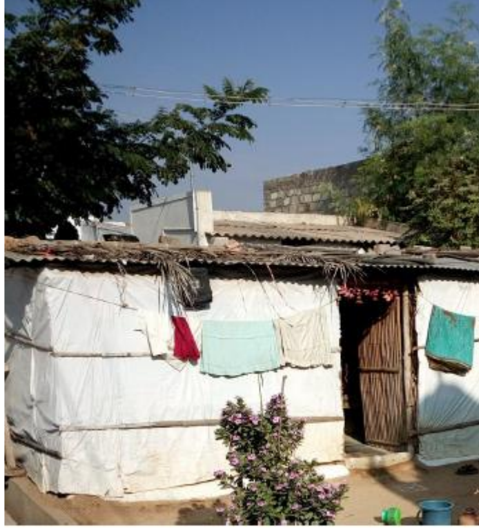
ಯಾದಗಿರಿಯಲ್ಲಿರುವ ಜಿಲ್ಲಾಂತರ್ಗತ ವಲಸಿಗ ಕೆಲಸಗಾರರ ಮನೆ

ಕೊಪ್ಪಳ ಕರ್ನಾಟಕದ ಒಂದು ಚಿಕ್ಕ ಜಿಲ್ಲಾ ನಗರ. ಈ ನಗರದಲ್ಲಿ ವಲಸಿಗ ಕೆಲಸಗಾರರಿಗೆ ಜೀವನ ನಿರ್ವಹಣೆಯ ಆಯ್ಕೆಗಳು ಬಹಳ ಕಡಿಮೆ. ಅಧ್ಯಯನ ತಂಡವು, ಮೆಹಬೂಬ್ ನಗರ, ಚುಕುನಲ್ ರಸ್ತೆ, ಭಾಗ್ಯನಗರ, ಓಜನಹಳ್ಳಿ ರಸ್ತೆ ಮತ್ತು ಕೊಪ್ಪಳದ ವಿಜಯ ನಗರ ಕಾಲೋನಿಗೆ ಭೇಟಿ ನೀಡಿತು. ಇಟ್ಟಿಗೆ ಭಟ್ಟಿ, ಕಟ್ಟಡ ನಿರ್ಮಾಣ ಸ್ಥಳಗಳಂತಹ ಕೆಲವೇ ಭಾಗಗಳಲ್ಲಿ ಕೆಲಸಗಾರರಿಗೆ ಉದ್ಯೋಗದ ಲಭ್ಯತೆ ಇತ್ತು. ಈ ವಿಭಾಗಗಳು ಹೆಚ್ಚಾಗಿ ಉತ್ತರ ಭಾರತದ ಕೆಲಸಗಾರರನ್ನು ಅಥವಾ ಅದೇ ಊರಿನವರನ್ನು ಆಕರ್ಷಿಸುತ್ತಿದ್ದವು. ಗ್ರಾಮೀಣ ಮತ್ತು ನಗರ ಪ್ರದೇಶಗಳನ್ನೊಳಗೊಂಡಂತೆ, ಕೊಪ್ಪಳದ ಸುತ್ತಮುತ್ತಲಿನ ಭಾಗದಿಂದ ಜನರು, ಕೆಲಸಕ್ಕಾಗಿ ಬೆಳಗಿನ ಹೊತ್ತು ನಗರಕ್ಕೆ ಬಂದು, ಸಂಜೆ ತಮ್ಮ ಸ್ಥಳಗಳಿಗೆ ವಾಪಸ್ಸು ಹೋಗುತ್ತಿದ್ದರು.