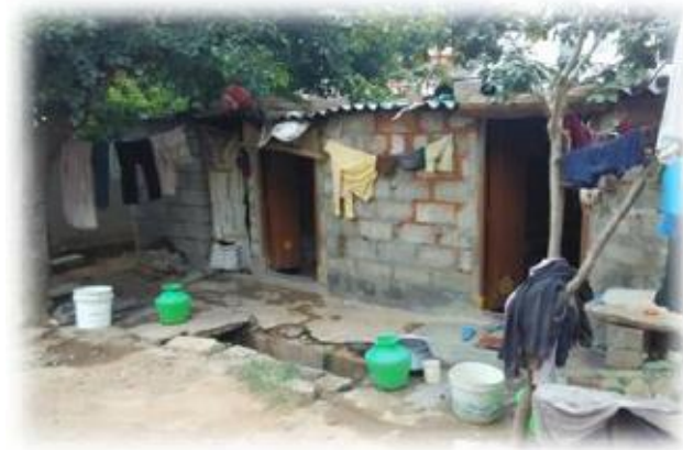
ಬೆಂಗಳೂರಿನಲ್ಲಿರುವ ಕೆಲಸಗಾರರ ಮನೆ

ಬೆಂಗಳೂರಿನ ಕಟ್ಟಡ ನಿರ್ಮಾಣ ಸ್ಥಳದಲ್ಲಿ ಕೆಲಸಗಾರರು ಮದುವೆ ಕಾರ್ಯಕ್ರಮಕ್ಕೆ ತಯಾರಿ ನಡೆಸುತ್ತಿರುವುದು