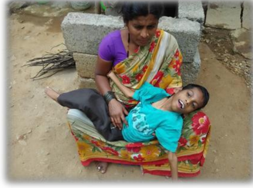
ಬೆಂಗಳೂರಿನಲ್ಲಿ ಮಗುವಿನ ಜೊತೆಯಲ್ಲಿ ವಲಸಿಗ ಮಹಿಳೆ