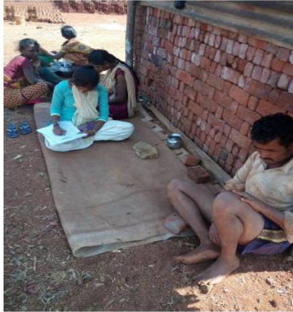
ಕೊಪ್ಪಳದಲ್ಲಿ ಇಟ್ಟಿಗೆ ಭಟ್ಟಿ ಕೆಲಸಗಾರರು

ಕೊಪ್ಪಳ ಕರ್ನಾಟಕದ ಒಂದು ಚಿಕ್ಕ ಜಿಲ್ಲಾ ನಗರ. ಈ ನಗರದಲ್ಲಿ ವಲಸಿಗ ಕೆಲಸಗಾರರಿಗೆ ಜೀವನ ನಿರ್ವಹಣೆಯ ಆಯ್ಕೆಗಳು ಬಹಳ ಕಡಿಮೆ. ಅಧ್ಯಯನ ತಂಡವು, ಮೆಹಬೂಬ್ ನಗರ, ಚುಕುನಲ್ ರಸ್ತೆ, ಭಾಗ್ಯನಗರ, ಓಜನಹಳ್ಳಿ ರಸ್ತೆ ಮತ್ತು ಕೊಪ್ಪಳದ ವಿಜಯ ನಗರ ಕಾಲೋನಿಗೆ ಭೇಟಿ ನೀಡಿತು. ಇಟ್ಟಿಗೆ ಭಟ್ಟಿ, ಕಟ್ಟಡ ನಿರ್ಮಾಣ ಸ್ಥಳಗಳಂತಹ ಕೆಲವೇ ಭಾಗಗಳಲ್ಲಿ ಕೆಲಸಗಾರರಿಗೆ ಉದ್ಯೋಗದ ಲಭ್ಯತೆ ಇತ್ತು. ಈ ವಿಭಾಗಗಳು ಹೆಚ್ಚಾಗಿ ಉತ್ತರ ಭಾರತದ ಕೆಲಸಗಾರರನ್ನು ಅಥವಾ ಅದೇ ಊರಿನವರನ್ನು ಆಕರ್ಷಿಸುತ್ತಿದ್ದವು. ಗ್ರಾಮೀಣ ಮತ್ತು ನಗರ ಪ್ರದೇಶಗಳನ್ನೊಳಗೊಂಡಂತೆ, ಕೊಪ್ಪಳದ ಸುತ್ತಮುತ್ತಲಿನ ಭಾಗದಿಂದ ಜನರು, ಕೆಲಸಕ್ಕಾಗಿ ಬೆಳಗಿನ ಹೊತ್ತು ನಗರಕ್ಕೆ ಬಂದು, ಸಂಜೆ ತಮ್ಮ ಸ್ಥಳಗಳಿಗೆ ವಾಪಸ್ಸು ಹೋಗುತ್ತಿದ್ದರು.