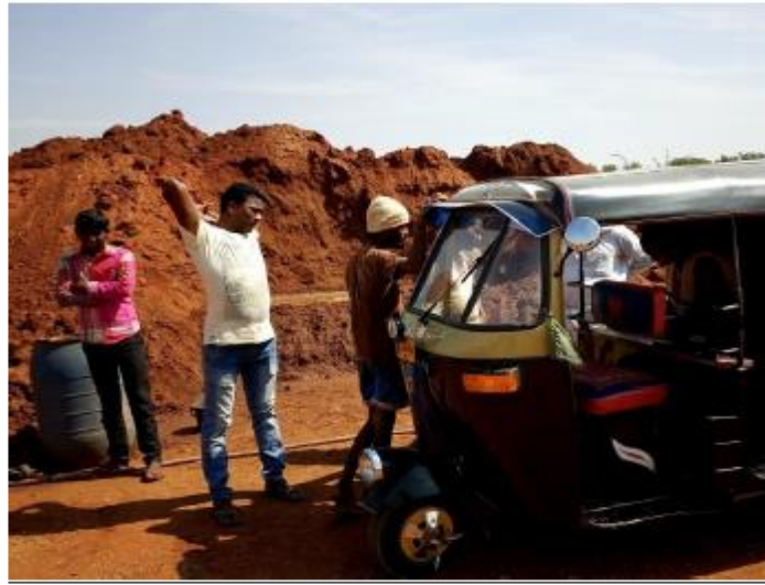
ಗೋವಾದಲ್ಲಿ ಅಂತರ್-ರಾಜ್ಯ ವಲಸಿಗ ಕೆಲಸಗಾರರ ಗುಂಪು ಕೆಲಸದ ಸ್ಥಳದಲ್ಲಿ ಇಳಿಯುತ್ತಿರುವುದು

ಗೋವಾದಲ್ಲಿ ಅಧ್ಯಯನ ನಡೆಸುತ್ತಿದ್ದ ತಂಡದವರಿಗೆ, ಉತ್ತರ ಕನ್ನಡ ಜಿಲ್ಲೆಯ ಜೋಯ್ಡಾ ಗ್ರಾಮದಿಂದ ಬಂದ ವಲಸಿಗ ಕೆಲಸಗಾರರನ್ನು ಹುಡುಕುವುದು ಕಷ್ಟವಾಗಿತ್ತು. ತಂಡದವರು, ಕಾರ್ಮಿಕ ಕಾರ್ಯದರ್ಶಿಯವರ ಕಚೇರಿಯನ್ನು ಸಂಪರ್ಕಿಸಿತು. ಅವರು ಸಂಬಂಧಪಟ್ಟ ಅಧಿಕಾರಿಗಳು ಮತ್ತು ಸಂಸ್ಥೆಯ ಸಂಪರ್ಕವನ್ನು ನೀಡಿದರು. ಅಧಿಕಾರಿಗಳು/ಸಂಸ್ಥೆಗಳು ಇವರಿಬ್ಬರೂ, ಅಧ್ಯಯನದಲ್ಲಿ ಭಾಗವಹಿಸುವವರನ್ನು ತಲುಪುವಲ್ಲಿ ಅಧ್ಯಯನ ತಂಡಕ್ಕೆ ಸಹಾಯ ಮಾಡಿದರು. ಅವರಲ್ಲಿ ಒಬ್ಬರು ಘನ ತ್ಯಾಜ್ಯ ನಿರ್ವಹಣೆಯಲ್ಲಿ ಕೆಲಸ ಮಾಡಿದವರಾಗಿದ್ದು, ಅವರಿಗೆ ಕೆಲವು ಕಾರ್ಮಿಕ ಗುತ್ತಿಗೆದಾರರ ಪರಿಚಯವಿತ್ತು. ಇನ್ನೊಬ್ಬರು, ಮಾನವ ಹಕ್ಕುಗಳ ಹೋರಾಟಗಾರರಾಗಿದ್ದು, ಗೋವಾದಲ್ಲಿರುವ ಕಾರ್ಮಿಕರ ತೊಂದರೆಗಳನ್ನು ಪ್ರತಿಪಾದಿಸುವ "ಸಾಹಸ" ಎನ್ನುವ ಸಂಸ್ಥೆಯ ಜೊತೆ ಸೇರಿದವರಾಗಿದ್ದರು. ಅವರ ಶಿಫಾರಸ್ಸಿನಂತೆ, ಅಧ್ಯಯನ ತಂಡವು ಬರ್ನಾ, ಪೋಂಡಾ, ವಾಸೋ ಮತ್ತು ಪೋರ್ವೋರಿನ್‌ಗಳಿಗೆ ಭೇಟಿ ಕೊಟ್ಟು, ಜೋಯ್ಡಾದ (ಉತ್ತರ ಕನ್ನಡದ) 15 ಮತ್ತು ಬೆಳಗಾವಿಯ 36 ವಲಸಿಗ ಕೆಲಸಗಾರರನ್ನು ಸಂದರ್ಶಿಸಿತು.